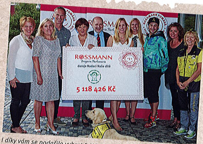
I díky vám se podařilo vybrat 5 118 426 Kč na pomoc ohroženým dětem.