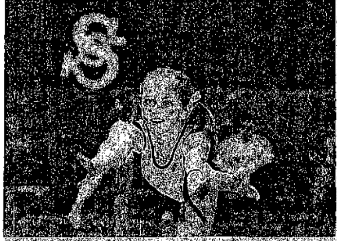
ČETI CVIČÍ PRO DĚTI. Malé sokolky cvičí na podporu zrakově postižených dětí.

Olomouc (rav, jup) - Jediná česká miss, která se v roce 1995 stala nejkrásnější ženou Evropy, byla včera ozdobou cvičení, které na podporu zrakově postižených dětí uspořádala Nadace profesora Vejvodského a Sokol Olomouc. Výtěžek z akce poputuje i do Speciální školy pro zrakově postižené v Litovli. Zrakově postižené děti by se podle Židkové měly více zapojit do společenského dění. „Nejde jen o samotné cvičení, ale především o vytvoření porozumění mezi zdravými a postiženými dětmi. Pokud mám ze své pozice Miss Evropy možnost propůjčit podobné akci své jméno, udělám to ráda,“ uvedla Židková. V olomoucké sokolovně panovala před příjezdem miss rušná atmosféra. Dětské cvičenkyně Moniku