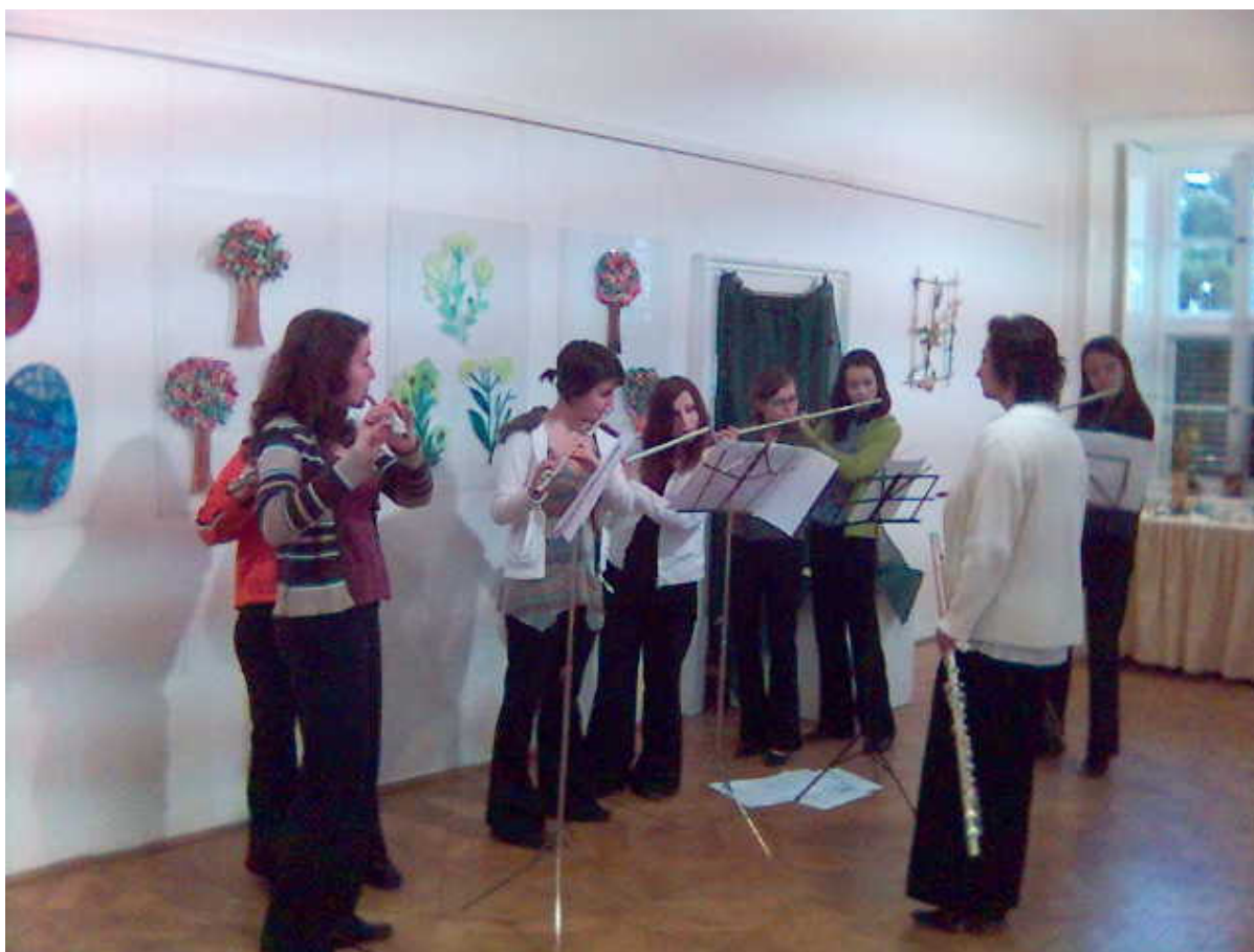
Vernisáž výstavy na zámku v Náměšti na Hané